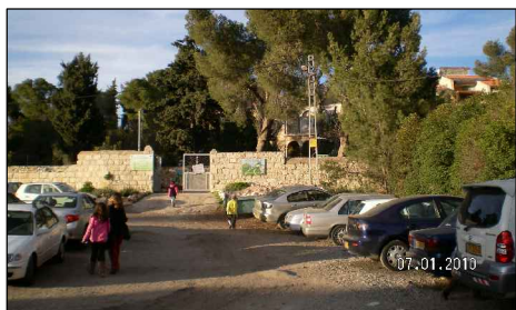
מבט מרחוב המגיד צפונה אל הכניסה למוזיאון הסבע