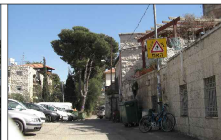
רחוב המגיד - מבט מזרחה