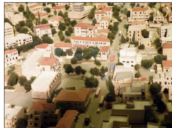
צילום מודל העיר / מבט צפון-מזרח: בית 'אדם', רח' המגיד, המרכז הקהילתי