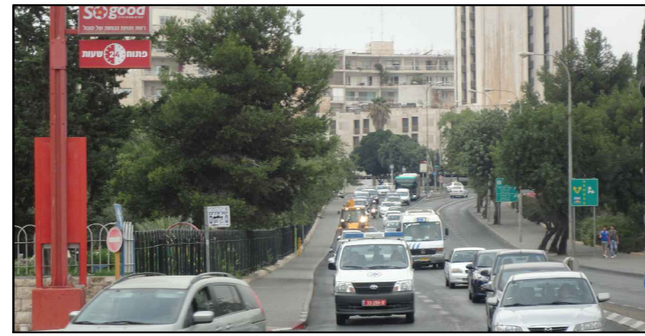
מבט מדרום - מצב קיים

תאור: קשר הולכי רגל בין מתחם המושבות (רח עמק-רפאים) ומרכז העיר שטח: גדה מערבית 9000 מ"ר