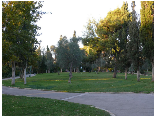
שביל בגן 23.11.09