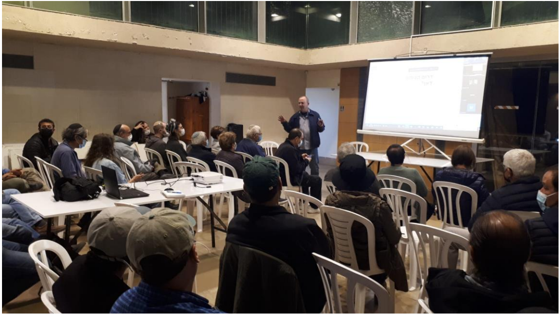
צילומים מהכנס תושבים